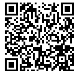
参加申込用 QR コード