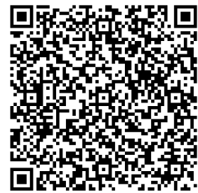
オンライン参加用 QR コード

遠方にお住まいなどの事情で当日のご来校が難しい方のために、オンラインでの同時配信を実施します。Microsoft Teams を使用して行いますので、対面での参加者とも歓談していただける予定です。オンラインでの参加を希望される方は、参加申込フォーム(プリント表面の QR コードよりアクセス)にて「オンライン参加を希望」を選択していただいたうえで、当日 11 時 10 分以降に、右の QR コードよりご参加ください。(交流会は 11 時 25 分より開始します)